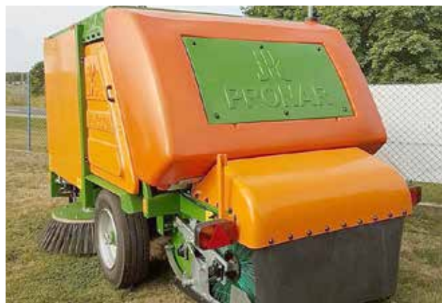
ZAMIATARKA ZMC 3.0 PRONAR

W ramach Rządowego Funduszu Polski Ład: Program Inwestycji Strategicznych Gmina Rymań wnioskuje o dofinansowanie projektów tj: