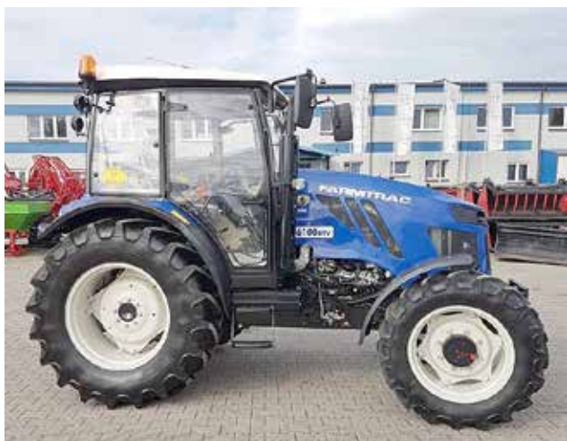
CIĄGNIK FARMTRAC 6100