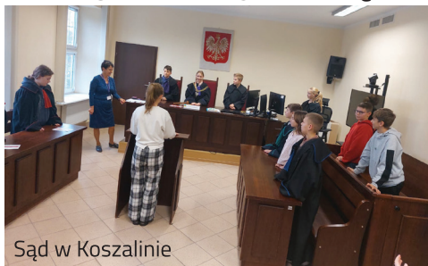
Sąd w Koszalinie

Na zakończenie wizyty uczniowie otrzymali egzemplarze Konstytucji oraz drobne materiały pamiątkowe.