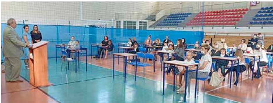
ROZPOCZĘCIE ROKU SZKOLNEGO 2020/2021