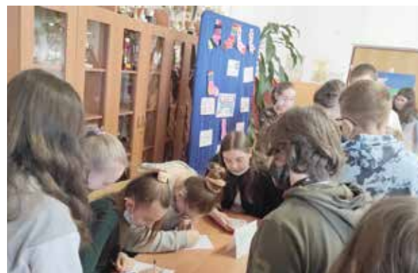
Dzień kolorowej skarpetki - solidaryzując się z dziećmi z Zespołem Downa