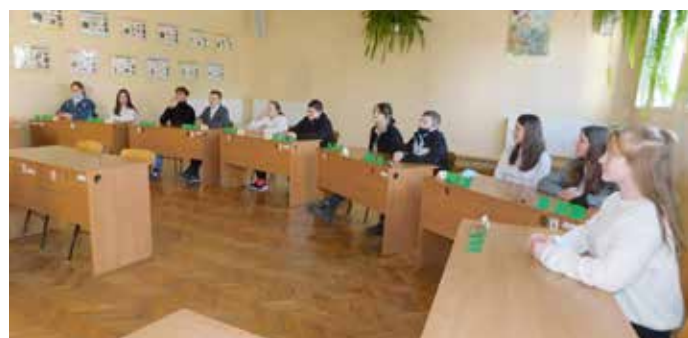
Konkurs wiedzy o Tadeuszu Kościuszcze Jeden z dziesięciu