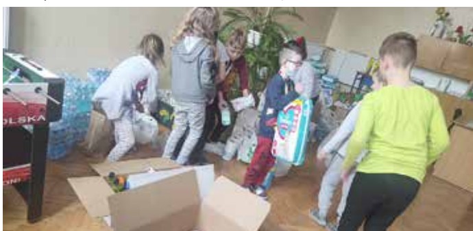
Zbiórka dla Ukrainy